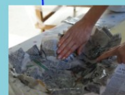
Illustrazione della Cittadella e visita ai carri allegorici Visita al museo Tecnica della cartapesta: laboratorio creativo Durata: 2 ore e mezzo

È possibile personalizzare le visite con percorsi museali specifici e l'attività di laboratorio