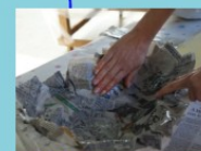
Illustrazione della Cittadella e visita ai carri allegorici Visita al museo Tecnica della cartapesta: laboratorio creativo Durata: 2 ore e mezzo

È possibile personalizzare le visite con percorsi museali specifici e l'attività di laboratorio