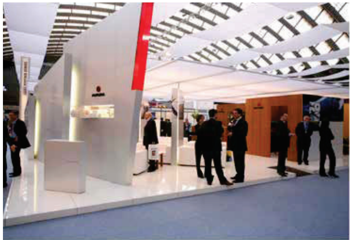
INDUSTRIE CARTARIE TRONCHETTI Spazio espositivo PLMA AMSTERDAM 2007