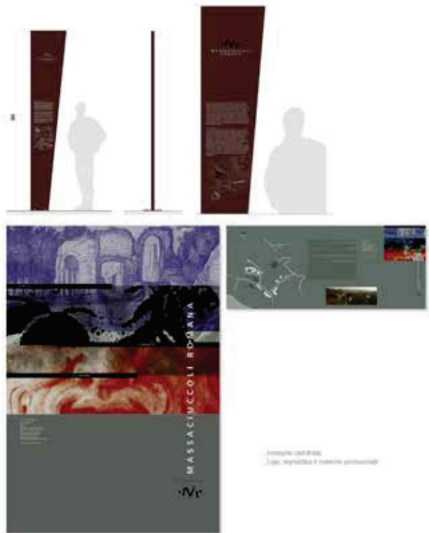
Foto: C. Lora - architetto Foto: Repubblica e Invenire - poliforme

ABCDEFGHIJKLMNOPQRSTUVWXYZ abcdefghijklmnopqrstuvwxyz 1234567890,.;!@#% ^&()