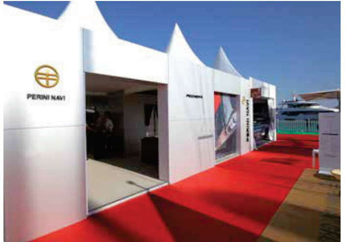
PERINI NAVI Spazio espositivo MYS MONTECARLO 2017